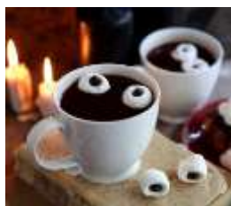
Naty, 8. B

Na párátko napíchněte marshmallowny, do kterých zatlačte malé čokoládové čočky a opatrně je ponořte do hrnku s horkou čokoládou.